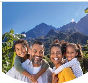
Les familles réunionnaises au cœur de nos priorités Mobilisés pour plus de solidarité