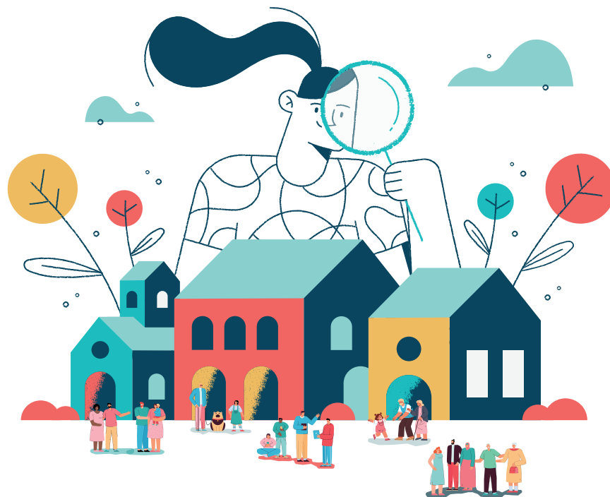
Schéma départemental de l'animation de la vie sociale