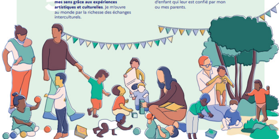
Cette charte établit les principes applicables à l'accueil du jeune enfant, quel que soit le mode d'accueil, en application de l'article L. 214-1-1 du code de l'action sociale et des familles. Elle doit être mise à disposition des parents et déclinée dans les projets d'accueil.

J'ai besoin que les personnes qui prennent soin de moi soient bien formés et s'intéressent aux spécificités de mon très jeune âge et de ma situation d'enfant qui leur est confié par mon ou mes parents.