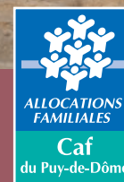
Réalisation Caf 63 - Janvier 2025 - Crédits photos Freepik