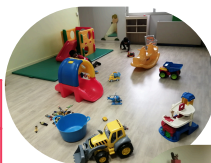
Espaces de jeux de 0 à 6 ans