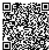
flyer parent seul