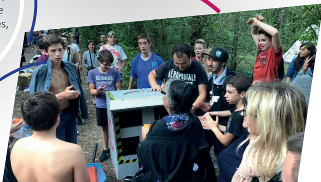
Un projet de jeunes, accompagné par la coopération Envol et L'Oison