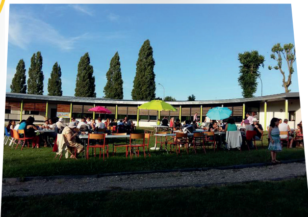
La Fête des Familles par l'Oison, pour fêter l'arrivée de l'été de façon conviviale !

Les données chiffrées sont issues de l'observatoire SENACS – Données 2018