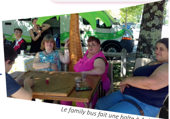
Le family bus fait une halte à Aubeterre

Le Family Bus circule sur l'ensemble du territoire... un lieu convivial pour notamment avoir accès à ses droits. Une «causerie ambulante» pourra se greffer à ce projet pour partager des moments conviviaux au coeur d'es communes.