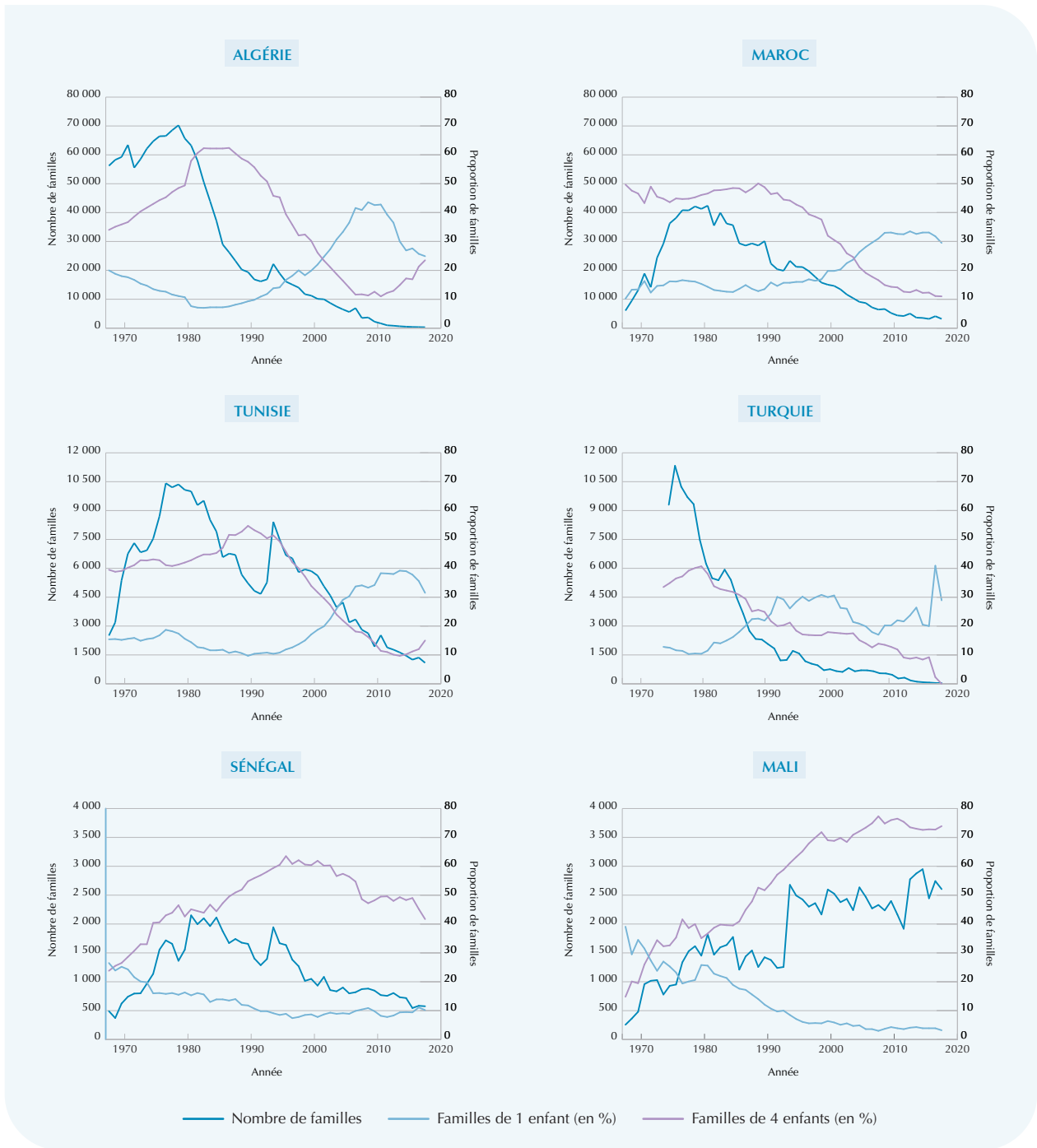
Graphique 1 – Nombre et composition des familles bénéficiaires des prestations familiales à l'étranger selon la nationalité du parent résidant en France, 1968 – 2018